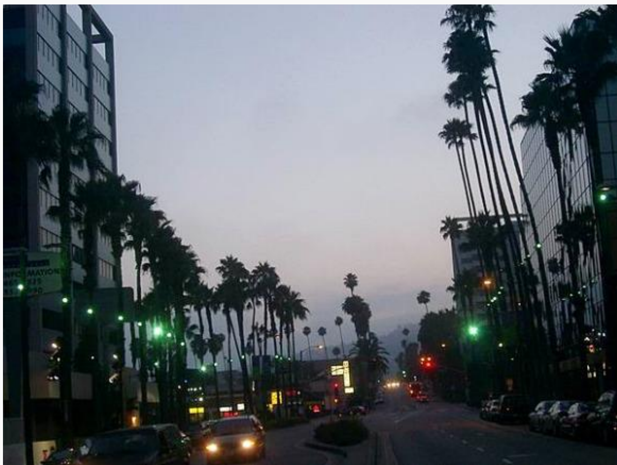
Hollywood Boulevard en soirée

Nos amis québécois, les 150.000 français qui ont la chance d'habiter déjà aux USA, ou ceux qui passent simplement à Los Angeles pendant leur road trip, arriveront certainement plus tôt, seront certainement plus en forme pour commencer à profiter de la plus grande ville Californienne et pourront commencer à s'intéresser au programme des deux jours suivants. Pourquoi ne pas dîner alors dans un restaurant typique d'ici, comme l'historique Pig'n Whistle , ex restaurant des stars au 6714 Hollywood Boulevard aujourd'hui populaire mais sympa. Toujours sur Hollywood Boulevard mais au 6687, The Musso and Franck Grill , le plus vieux restaurant d'Hollywood qui a fêté ses 100 ans en 2019 !